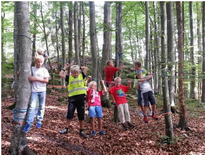
Bilde viser eksempel på barns lek i Børresen skogen.

Området Børresenskogen, gbnr. 2009/14, tas ut av den pågående reguleringsplan . Med en grundigere og ny gjennomgang av området og med bakgrunn i RPBA, vil det være hensiktsmessig at eiendommen tas med ved neste rullering av kommuneplanens arealdel og byplan. »